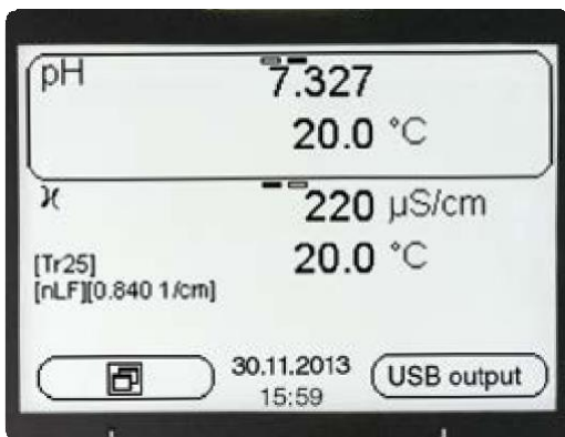
Pantalla con dos valores de medición