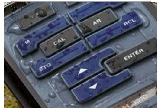
Robusto teclado de silicona, sellado – 100 % resistente al agua