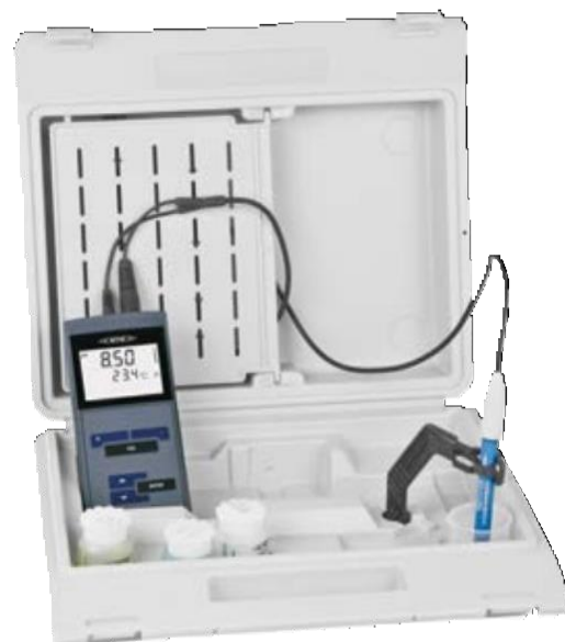
Juego en estuche

(Utilice el código QR para mayor conveniencia).